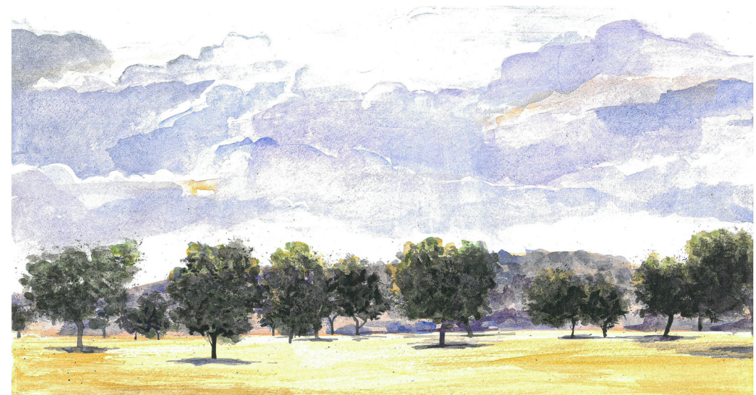
TARDE DE VERANO