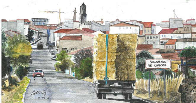
CARRETERA DE CARDEÑA

VILLANUEVA ES UN ESPACIO DE ARRAIGO Y CALMA, UN LUGAR DONDE EL PAISAJE Y LA VIDA COTIDIANA SE ENTRELAZAN DE MANERA ÚNICA.