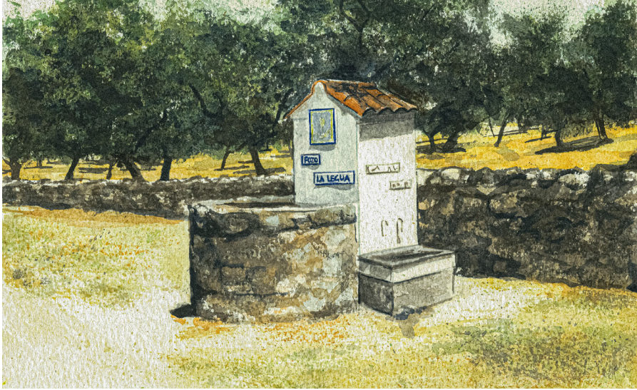
POZO LA LEGUA