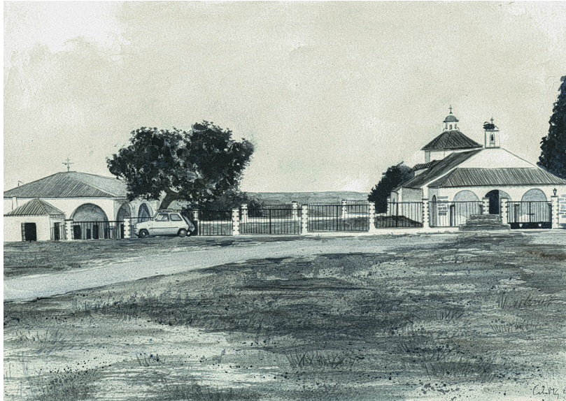
ERMITA TIEMPO ATRÁS

MI INTENCIÓN ES QUE QUIENES OBSERVEN MI TRABAJO RECONOZCAN ESTOS PAISAJES, LOS SIENTAN COMO PROPIOS, COMO UNA REPRESENTACIÓN DE SU HOGAR Y DE SUS RECUERDOS.